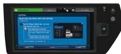
Manuel utilisateur accessible depuis l'écran tactile du système