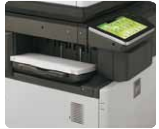
Unité de finition interne