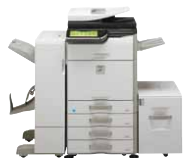
Système standard Meuble support 3 x 500 feuilles Plateau de sortie Unité de finition livret + passage papier Magasin latéral