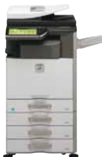
Système standard Meuble support 3 x 500 feuilles Plateau de sortie Unité de finition interne