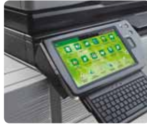
Ecran tactile couleur inclinable et clavier externe