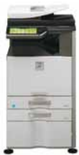
Système standard Meuble support 1 x 500 feuilles