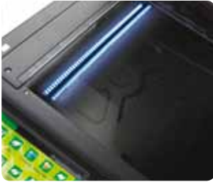
Lampes LED basse consommation