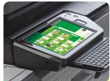
Stockage et prévisualisation couleur des documents