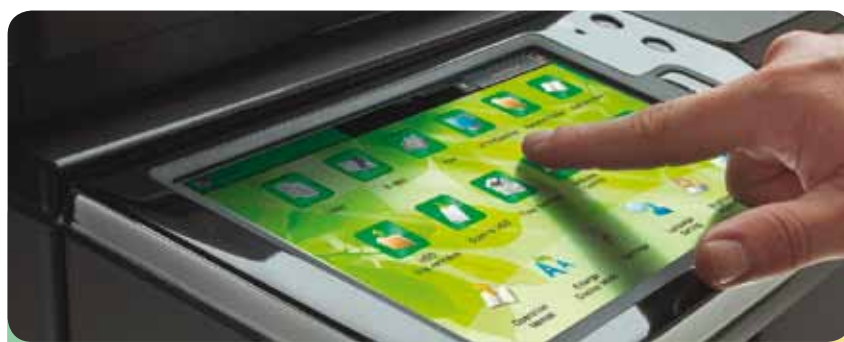
Un écran tactile à la pointe de la technologie pour une navigabilité intuitive

Le MX-3610N embarque un écran unique sur le marché de l'impression : un écran 10" doté de la technologie tactile qui a déjà révolutionné notre quotidien via les smart phones et les tablettes PC. L'aperçu du travail en cours permet de retravailler le document, supprimer ou ajouter une page, et ce par des appuis longs et des touches glisser. Utiliser l'interface tactile d'un MFP n'a jamais été aussi intuitif et convivial.