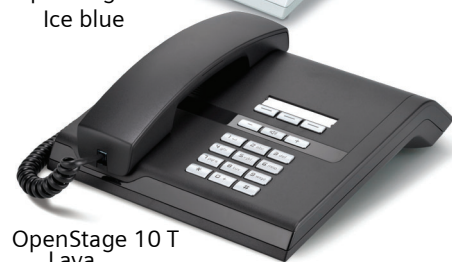
OpenStage 10 T Lava