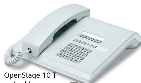
OpenStage 10 T Ice blue