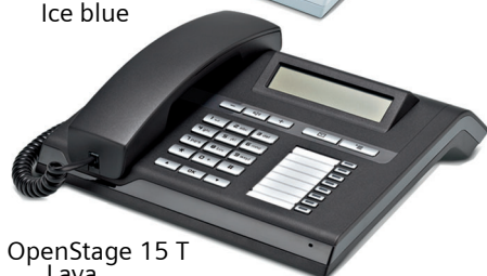
OpenStage 15 T Lava