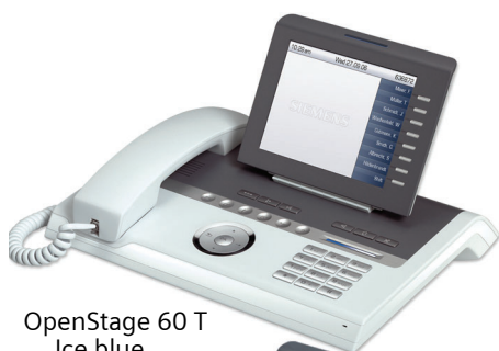
OpenStage 60 T Ice blue