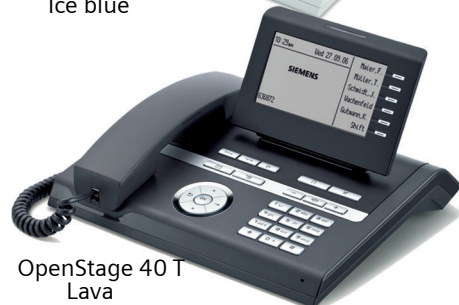
OpenStage 40 T Lava