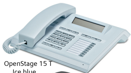
OpenStage 15 T Ice blue