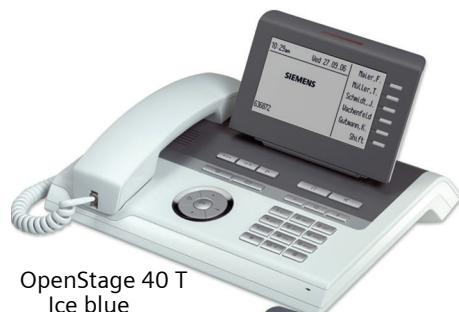
OpenStage 40 T Ice blue