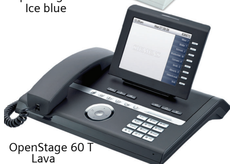
OpenStage 60 T Lava