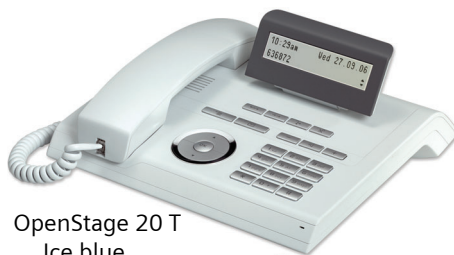
OpenStage 20 T Ice blue