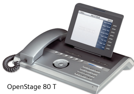
OpenStage 80 T