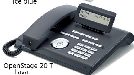
OpenStage 20 T Lava